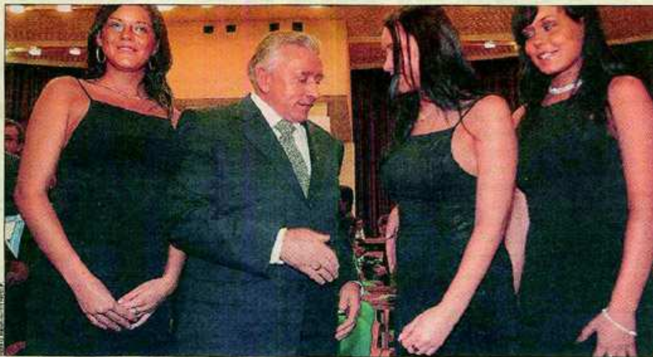
Andrzej Lepper był w sobotę na finale konkursu „Rolinik Pomorza i Kujaw 2006” w Bydgoszczy