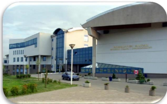
WPiA – Wydział Prawa i Administracji, ul. Bażyńskiego 6