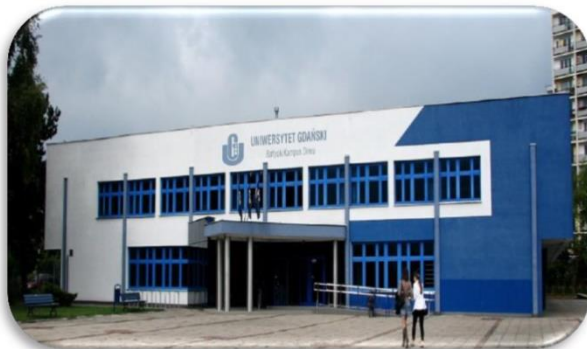
WS – Budynek przy ul. Wita Stwosza 58 (tzw. dawna stołówka)