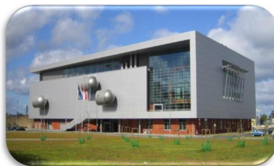
BG – Biblioteka Główna, ul. Wita Stwosza 53