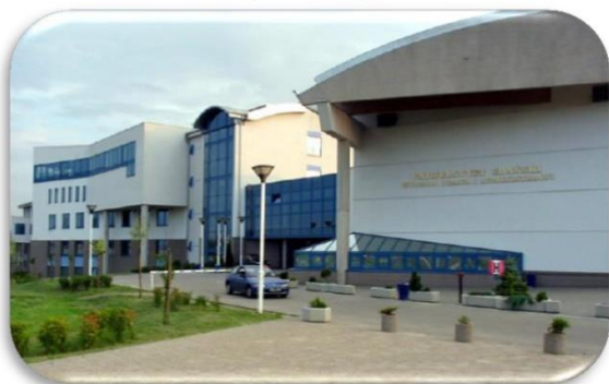
WPiA – Wydział Prawa i Administracji, ul. Bażyńskiego 6