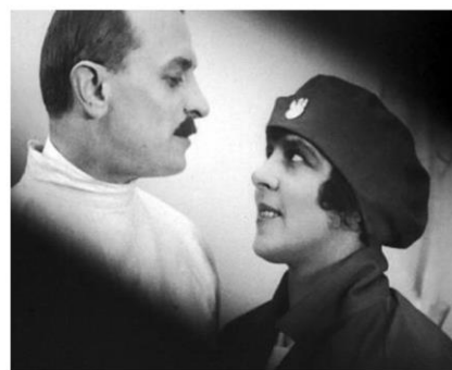
Pan Tadeusz, reż. Ryszard Oryński