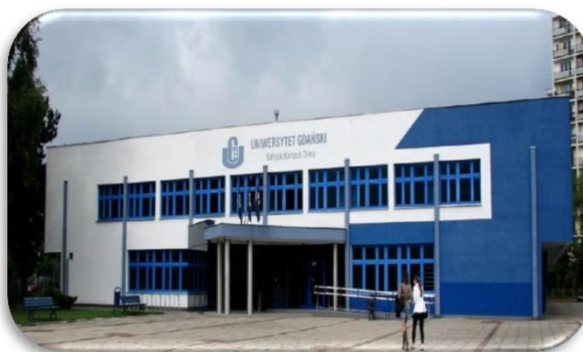
WS – Budynek przy ul. Wita Stwosza 58 (tzw. dawna stołówka)