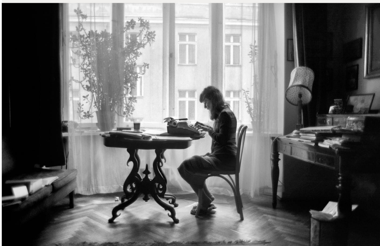
EWA KURYLUK, "AUTOFOTOGRAFIA W POKOJU MAMY NA FRASCATI" (1974)

WYDZIAŁ FILOLOGICZNY, STARY BUDYNEK, SALA 1.47