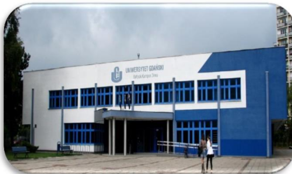
WS – Budynek przy ul. Wita Stwosza 58 (tzw. dawna stołówka)