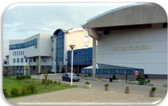
WPiA – Wydział Prawa i Administracji, ul. Bażyńskiego 6