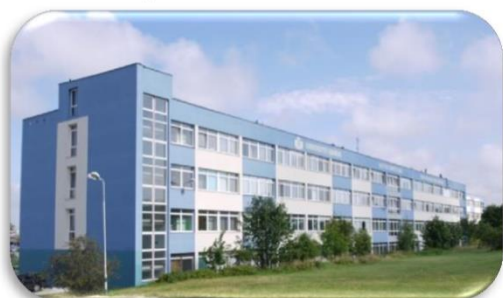
WMFI – Wydział Matematyki, Fizyki i Informatyki, ul. Wita Stwosza 57,