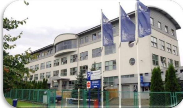
DREK – budynek przy ul. Bażyńskiego 1A, tu znajduje się Biuro GUTW