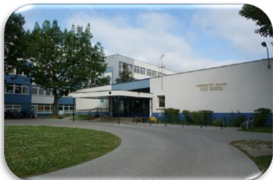
WFIL – Wydział Filologiczny, Historyczny, ul. Wita Stwosza 55