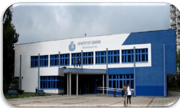
WS – Budynek przy ul. Wita Stwosza 58 (tzw. dawna stołówka)