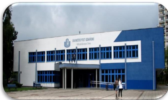
WS – Budynek przy ul. Wita Stwosza 58 (tzw. dawna stołówka)